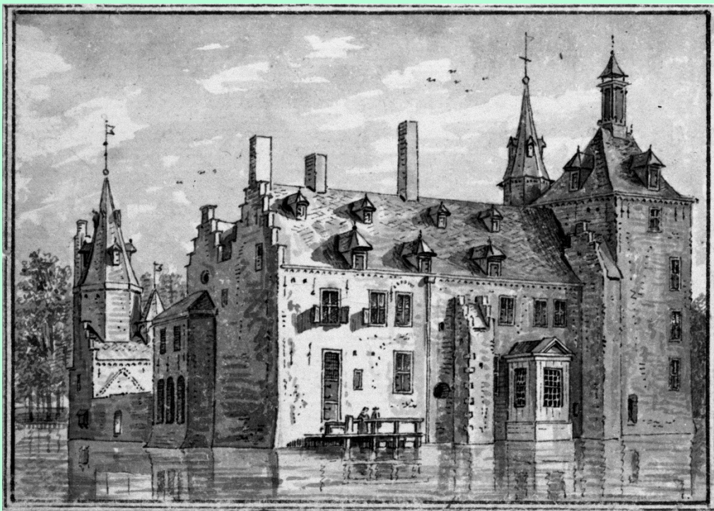
Kasteel Huys te Warmont (tekening, 1726)