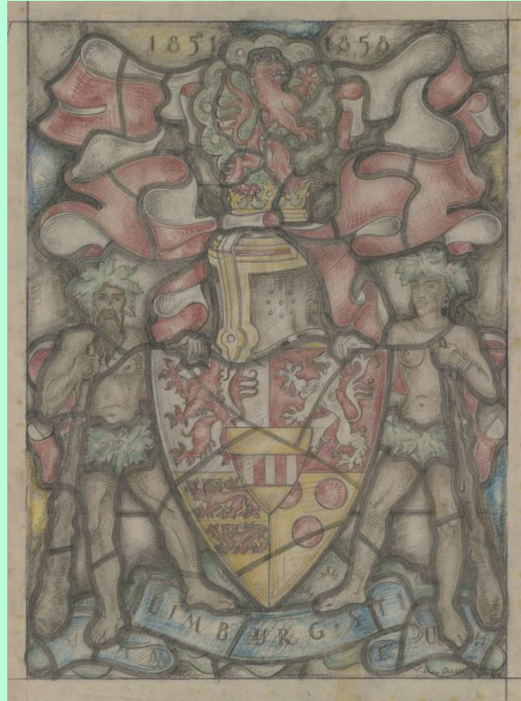
Gebrandschilderd raam in het stadhuis van Leiden met het wapen van de graaf

Graaf van Limburg Stirum staat bekend als een aimabel mens die veel goeds tot stand heeft gebracht. Het is dan ook niet vreemd dat hij enkele koninklijke onderscheidingen ontvangt: in 1853 wordt hij benoemd tot Kamerheer, in 1855 tot Commandeur in de Orde van den Eikenkroon en in 1857 ontvangt hij de Orde van de Nederlandsche Leeuw.