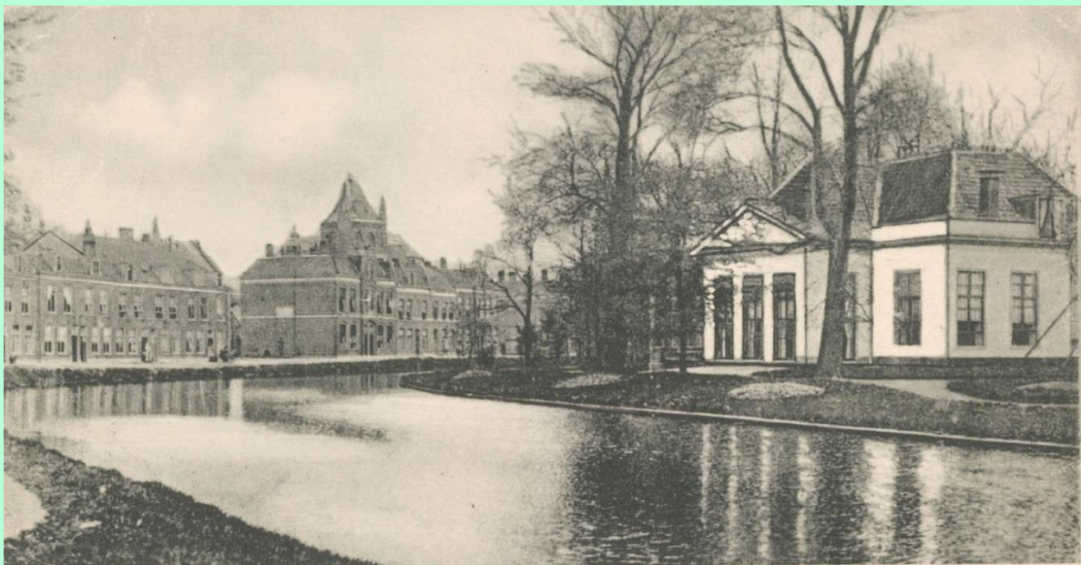
Leiden Vreewijk Schelpenkade Buitenhuis afgebroken in 1906.