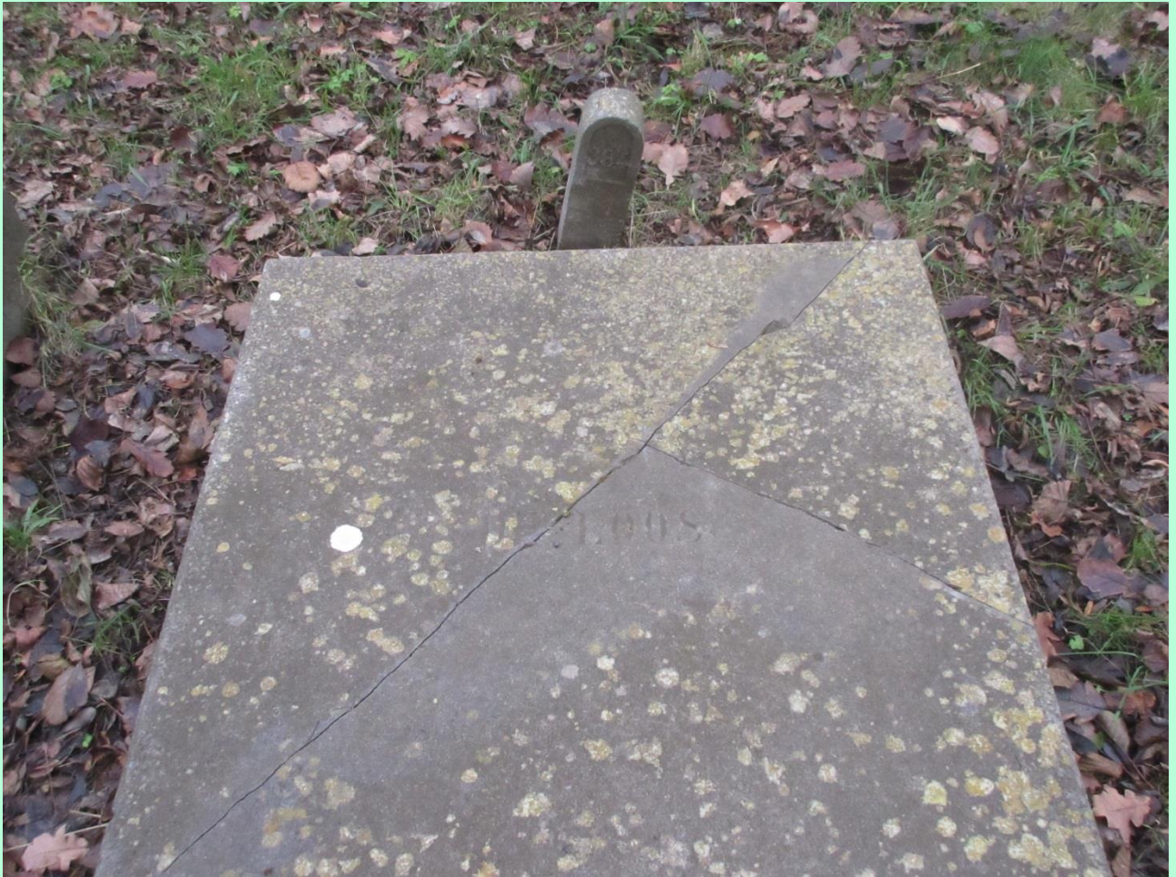
Familiegraf De Loos