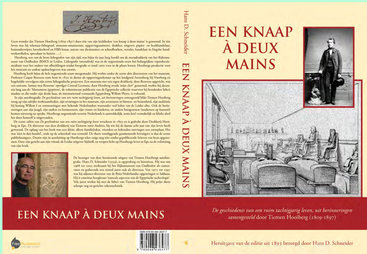
Voor- en achterzijde van het boek 'Een knaap à deux mains'