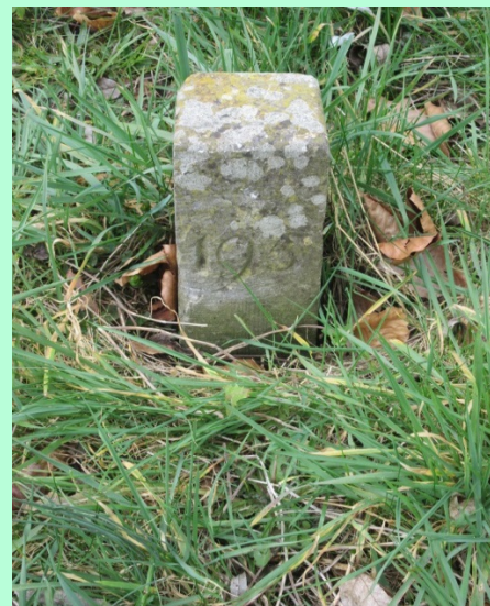
Zandgraf 195 (alleen het paaltje staat er nog)