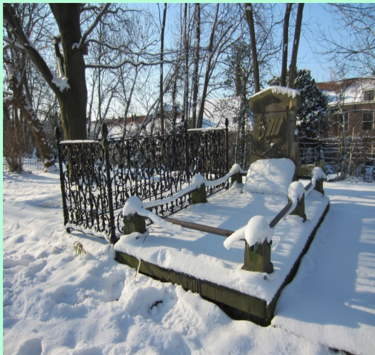
Overlijdensbericht (Leidsch Dagblad 26-11-1901)

Begravenis Woensdag 27 November, halftwaalf van het sterfhuis. 10615 26