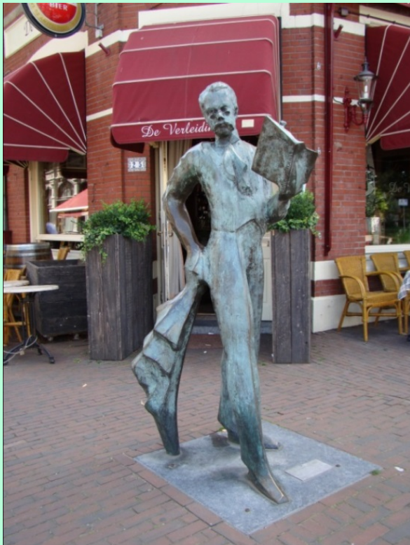
Bronzen beeld Emile Seipgens

In de binnenstad van Roermond is een beeldenroute uitgezet, met de personages uit de opera-bouffe, die begint bij de Steenen Brug met een beeld van Emile Seipgens zelf.