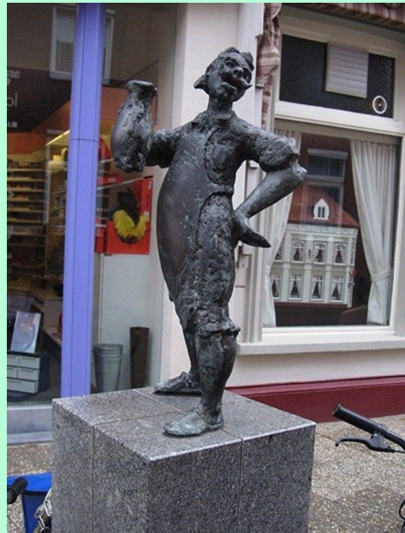
Bronzen beeld Schwarze Peter

Sinds juni 2017 maakt de opera-bouffe Schinderhannes deel uit van de Nationale Inventaris Immaterieel Cultureel Erfgoed van Unesco.