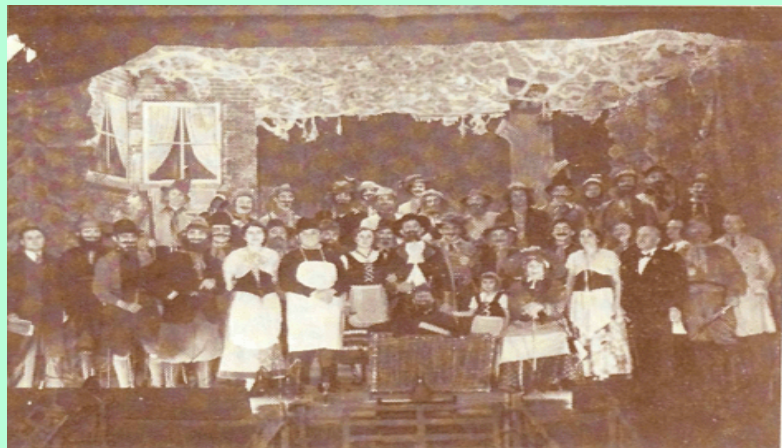
Tableau de la troupe 1939