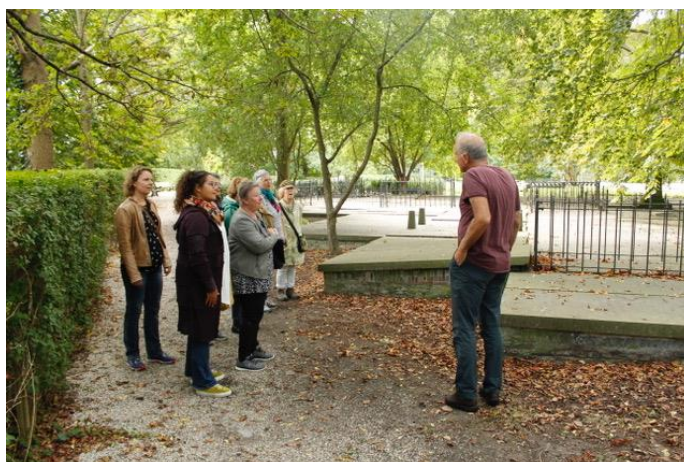
Rondleiding voor Issoria (een van de groepen)

Helaas kon dit jaar geen enkele lezing doorgang vinden. Wel is meegedaan aan de open monumentendagen op 11 en 12 september. Deze werden zeer goed bezocht en we telden een record aantal bezoekers: 550 personen. Op 19 september is een rondleiding gegeven voor het Els Borst netwerk en op 10 oktober was de rondleiding "Vrouwen op Groenesteeg". Ook was er voor zo'n 80 vrijwilligers van het Hospice Issoria op 30 september een rondgang over de begraafplaats. Verder waren rondleidingen niet mogelijk.