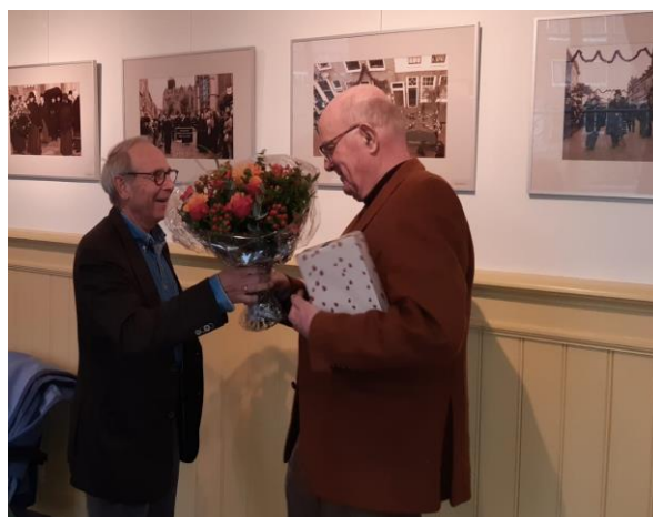
Afscheid Matthijs Snouck Hurgronje