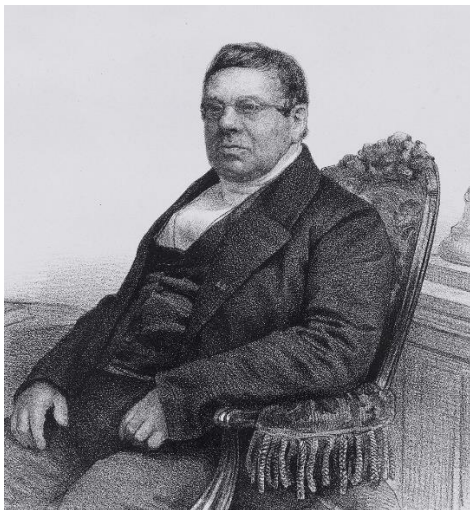
Lodewijk Caspar Luzac