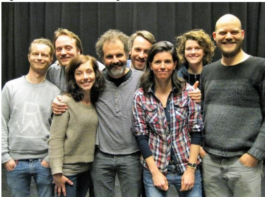
De cast van 'Spookhazen'

Tussen 31 augustus en 16 september speelde de Leidse Toneelgroep Al Dente op de keerkus van de begraafplaats Groenesteeg elf voorstellingen van Spookhazen en ander Gespuis , een collage van volkse vertellingen uit de Lage Landen. Ondanks het matige weer was het een groot succes. Alle voorstellingen waren uitverkocht.