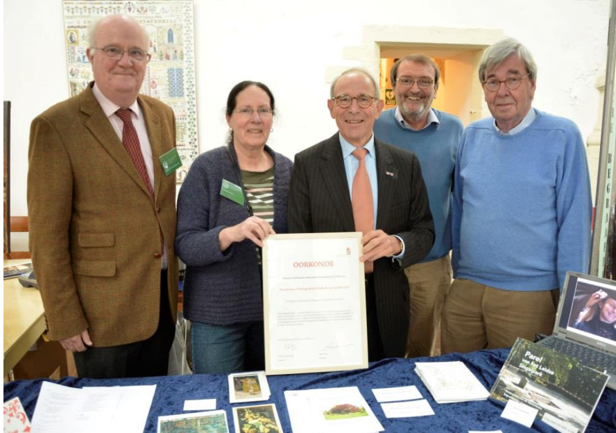
Het voltallig bestuur met oorkonde als winnaar van de Publieksprijs van de Historische Vereniging Oud Leiden