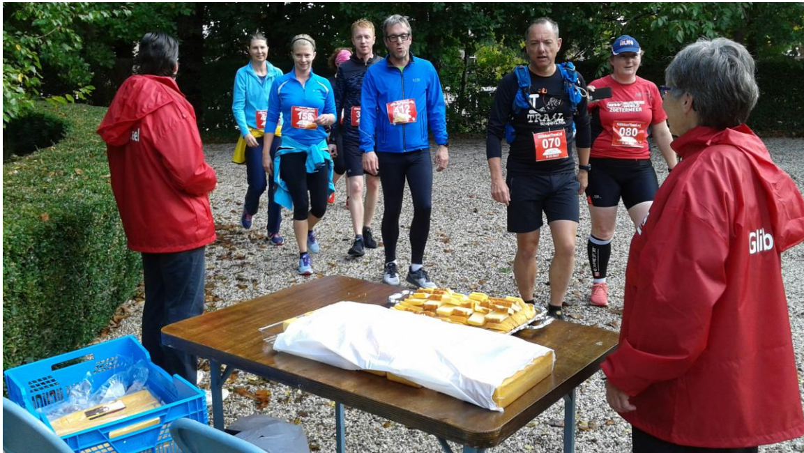
Een plakje cake bij de draaicirkel

Op 8 oktober werd voor de eerste keer in Leiden de 'Glibber Treel' georganiseerd. De organisatie was in handen van de Leidse Road Runners Club. Het parcours ging door de Leidse binnenstad en de begraafplaats Groenesteeg was onderdeel van de route. De deelnemers wandelden er een rondje en kregen bij de draaicirkel een plakje cake. Bij de aula speelde een trompettist en een gitarist.