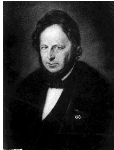
Graaf van Limburg Stirum